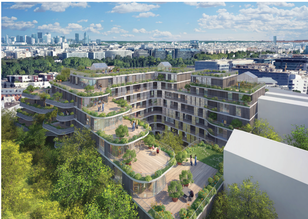
Résidence Ôm à Issy-les-Moulineaux » - Perspective Architecture Studio

• Icade poursuit son partenariat avec la Ligue pour la protection des oiseaux pour réintroduire les oiseaux sur plusieurs Parcs Icade.