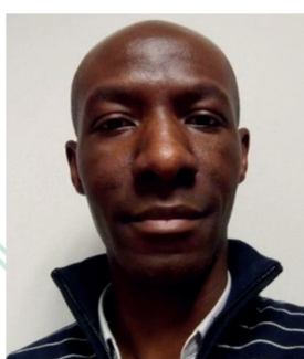
Nel-Yvon Galiu Regeltex Industrie, gants isolants