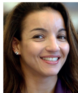
Sarah Ourahmoune Boxer Inside Sport