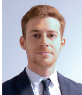
Bastien Brunis Agence Solicom Communication